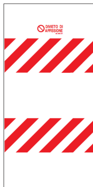
FIG. 9009 - Dimensione 1000x2000 mm